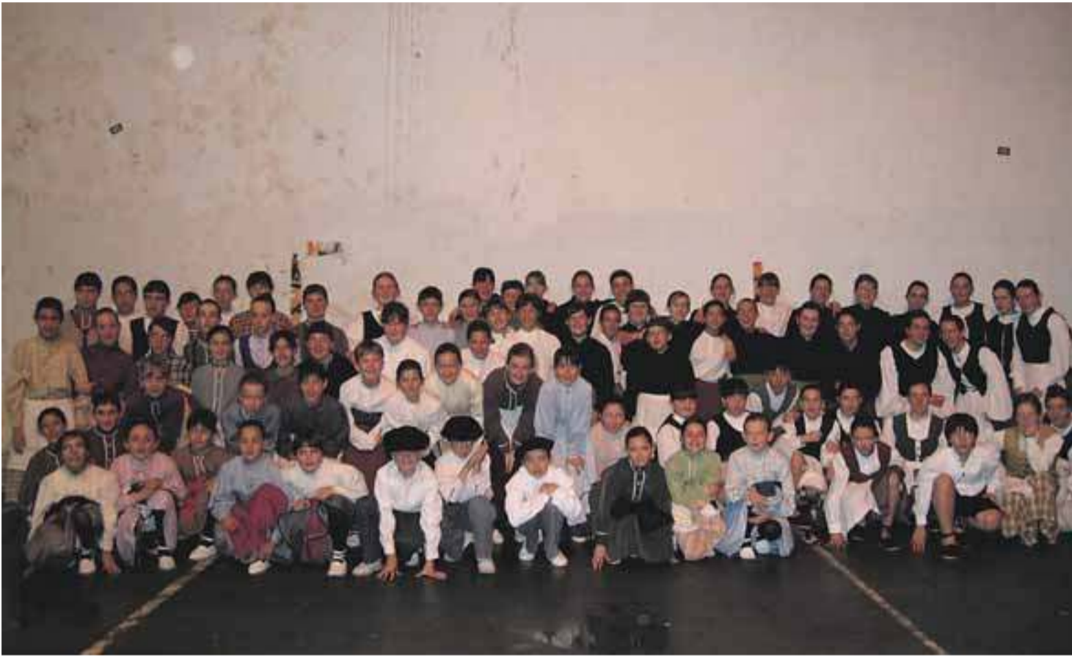
Los dantzaris que participaron en la actuación de Zaldibia el pasado 4 de abril.

Alurr Dantza Taldea ha comenzado con sus actuaciones de la temporada de primavera. El grupo ibartarra ofrecerá sus próximos espectáculos en el Herri Urrats de Senpere y en Ibarra. TEXTO Marta San Sebastián