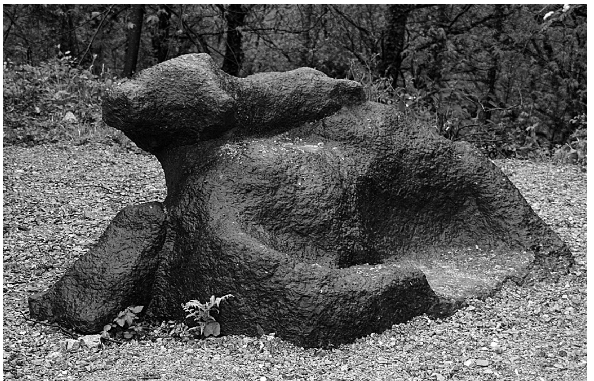
Koldobika Jauregiren eskulturak ikusi daitezke Urmaran. E.MAIZ